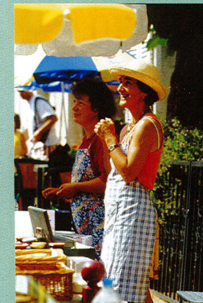
A Condat, les Marchés de Pays estivaux et la Foire des produits bios et de terroir mi-août attendent les gourmands !